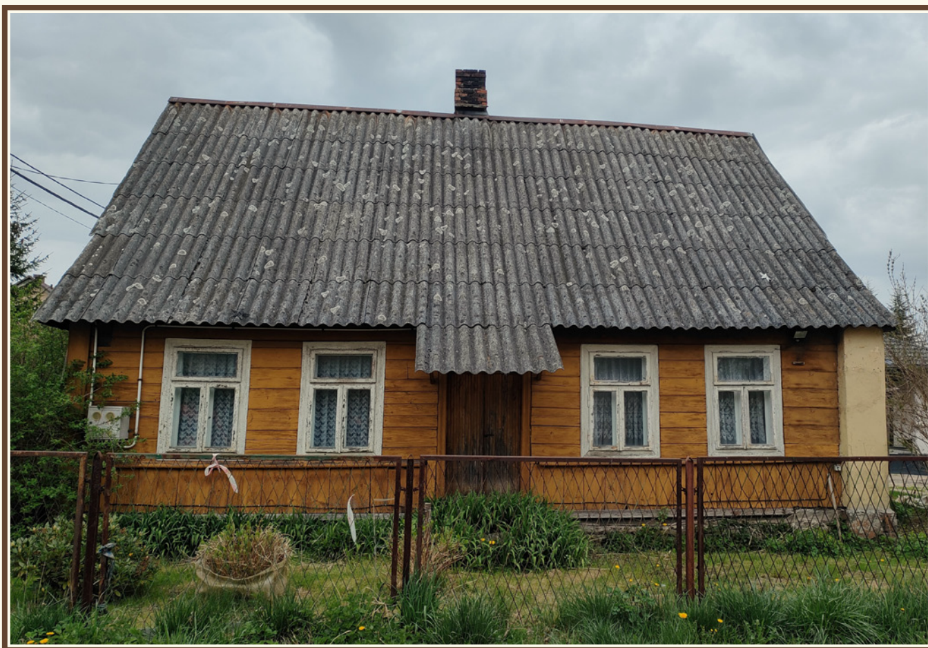
Fot. Marcin Janakowski