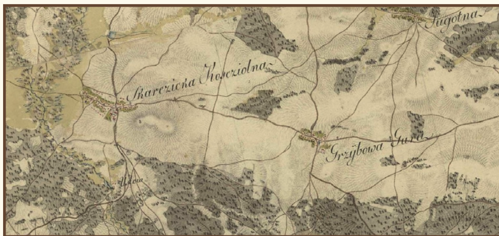
„Skarżysko Kościelne” – fragment mapy Carte von West-Gallizien welche [...] in den Jahren von 1801 bis 1804 unter Direction [...] Anton Mayer von Heldensfeld [...] aufgenom- men worden. Gezeichnet, und gestochen von Hieronimus Benedicti.

Z pozostałych miejscowości obecnej gminy mamy informacje o zabudowie Grzybowej Góry na początku XIX wieku (we wsi stało wówczas dwadzieścia siedem domów i karczma). W tym samym czasie w Kierzu Niedźwiedzim stało już trzysta siedem domostw, w Szczepanowie od sześciu do ośmiu, w Majkowie dwadzieścia osiem domostw, w Lipowym Polu trzydzieści jeden, w Świerczku aż sto trzydzieści sześć, ale jeszcze więcej w Michałowie, bo aż sto trzydzieści dziewięć! Co do innych miejscowości wchodzących w skład obecnej gminy w zasadzie nie posiadamy wiarygodnych informacji co do ich zabudowy (np. w postaci wykazu właścicieli i ich nieruchomości), poza informacjami poglądowymi ze źródeł o charakterze kartograficznym. Jedyna konkretna informacja dla tego okresu to potwierdzony dom i młyn „Piaska”.