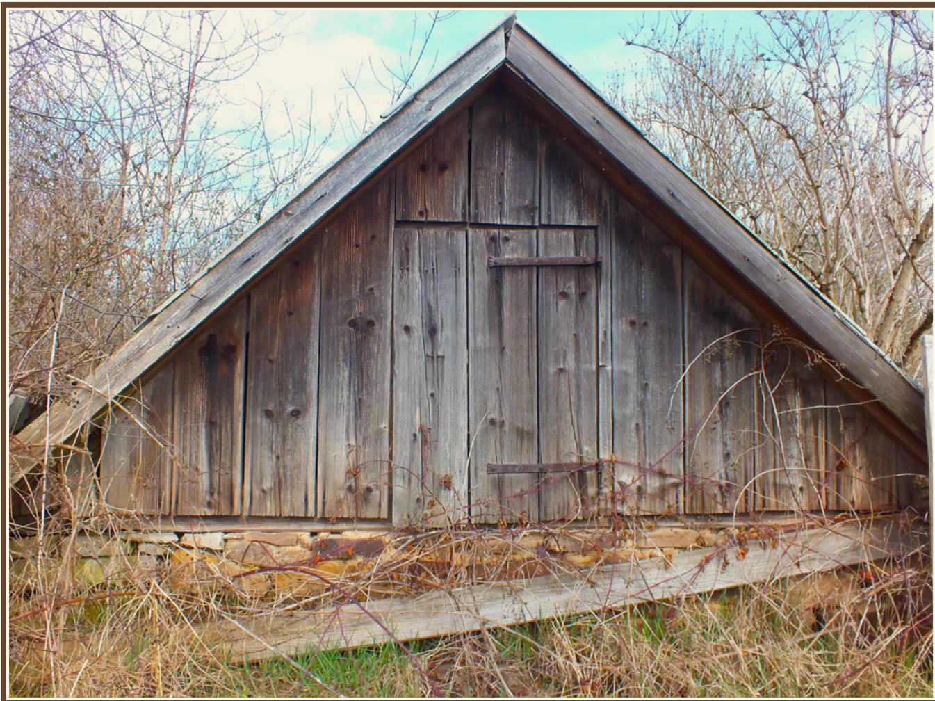
Przykład przydomowej piwniczki z zabudową drewnianą oraz dwuspadowym daszkiem (Łączna), fot. Piotr Kardys