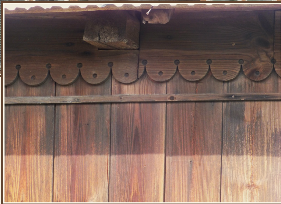
Przykłady zdobień na ścianach frontowych