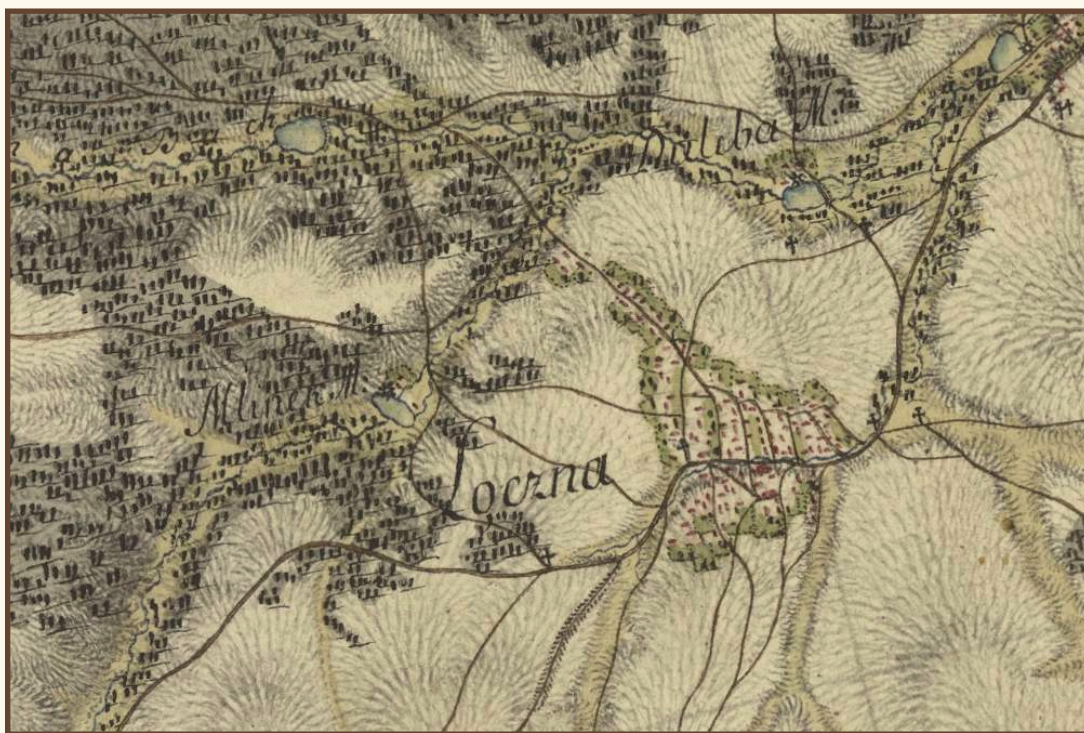
„Łączna” – fragment mapy Carte von West-Gallizien welche [...] in den Jahren von 1801 bis 1804 unter Direction [...] Anton Mayer von Heldensfeld [...] aufgenommen worden. Gezeichnet, und gestochen von Hieronimus Benedicti.

Z pozostałych miejscowości obecnej gminy informacje co do zabudowy zachowały się dla Dulęby (na początku XIX wieku stał tu jeden młyn o konstrukcji szkieletowej i dom). Z kolei w Goździe w tym samym czasie stało już trzydzieści domów (ale pod koniec wieku było już około setki domostw), w Klonowie osiemnaście, w Osełkowie dziewiętnaście.