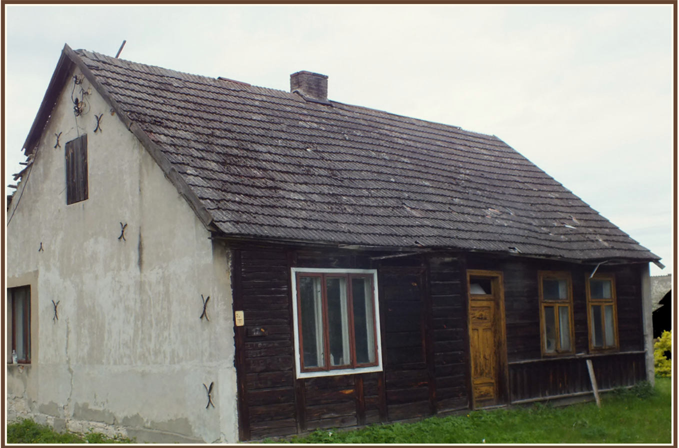
Przykład tzw. ściany ogniowej, tj. zabezpieczenie kamienne lub murarskie ściany budynku, którą uważano za najbardziej narażoną na podpalenie lub inne czynniki natury