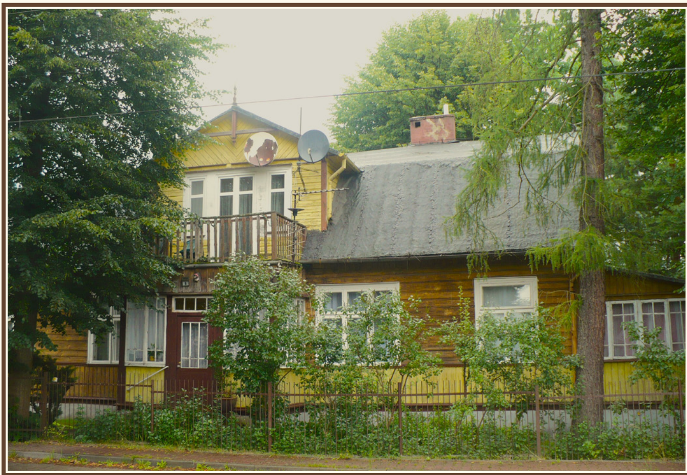
Zabudowania typu dworskiego przy ul. Bodzentyńskiej w Suchedniowie, fot. Piotr Kardyś.