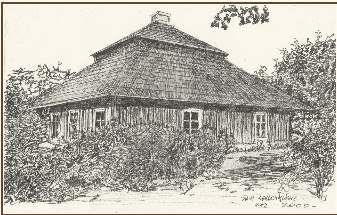
Dom w stylu dworowym, tzw. „Kałamarzyk”, pierwotnie w Suchedniowie przy ul. Warszawskiej, obecnie przeniesiony do Parku Etnograficznego w Tokarni, autor: Jan Spółczyński