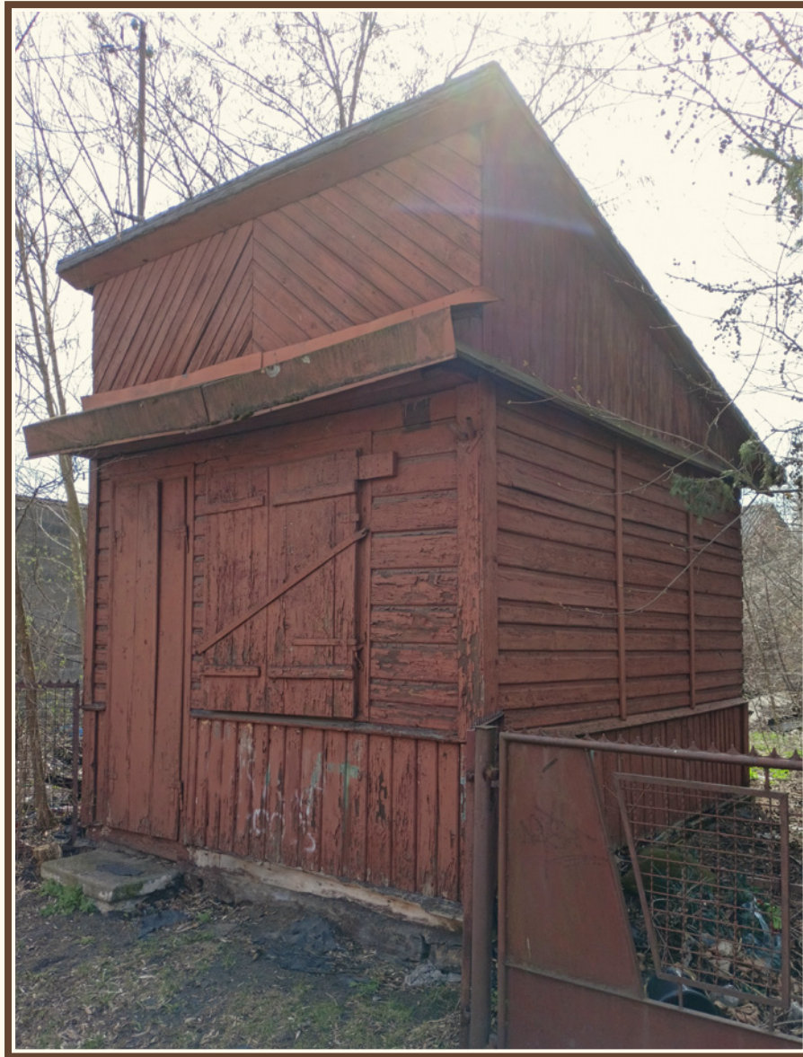
Przykład budynków drewnianych o charakterze usługowym (Skarżysko-Kamienna, osiedle Kamienna)