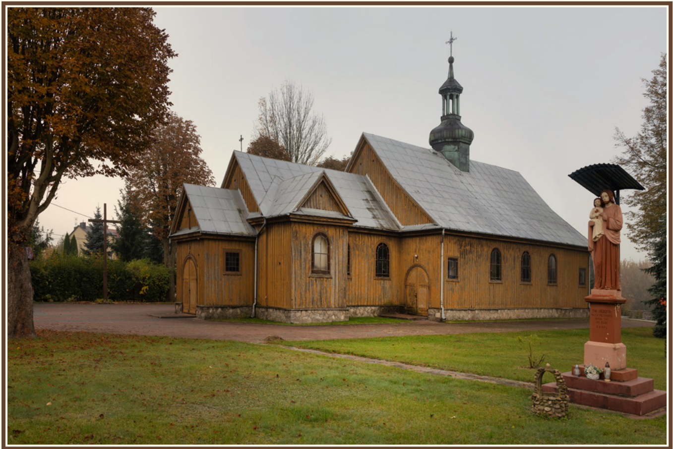
Kościół pod wezwaniem św. Józefa Oblubieńca NMP w Skarżysku-Kamiennej