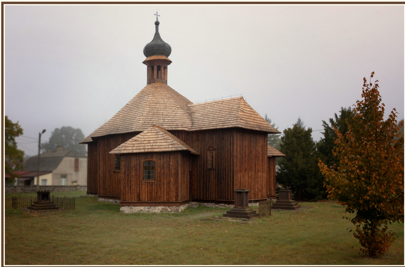
Kaplica św. Zofii w Bliżynie, fot. Krystian Drózdź.