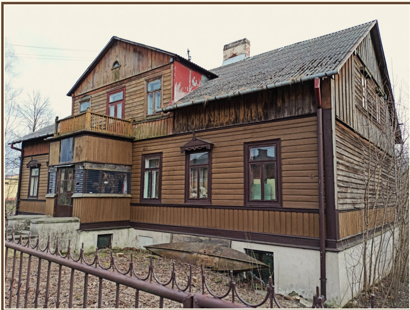
Przykład miejskiego budownictwa drewnianego Skarżyska-Kamiennej w stylu willowym (Kamienna), obecnie przy ul. Fabrycznej