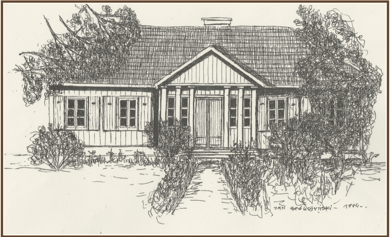
Dawny dworek Fitaszewskich, obecnie budynek Zgromadzenia Sióstr Imienia Jezusa w Suchedniowie przy ul. Kieleckiej, autor: Jan Spółczyński.