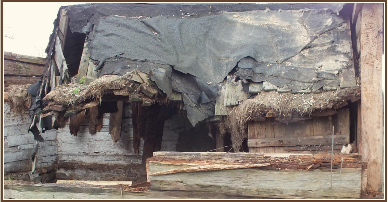
Rzadki już przykład budynku zwieńczonego dachem krytym strzechą (Suchedniów)