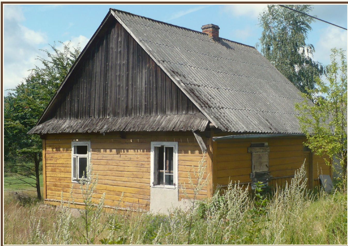
Przykład dachu dwuspadowego z tzw. okapem (Łączna)