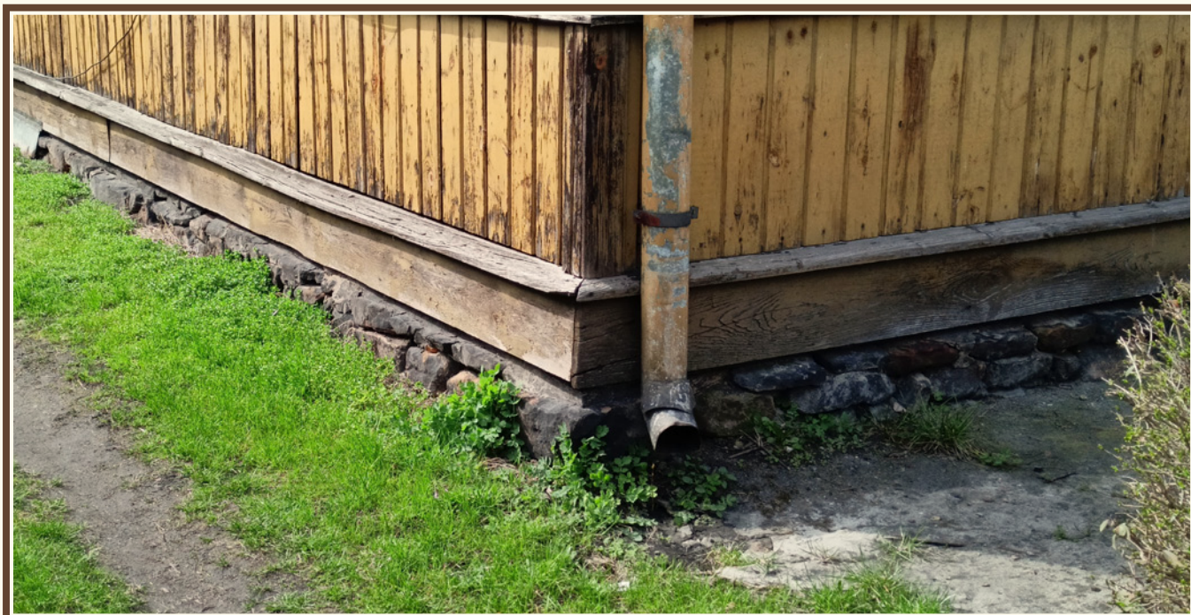
Przykład podmurówki wykonanej z kamieni polnych, miejscami uzupełnianej zaprawą murarską (Skarżysko-Kamienna)