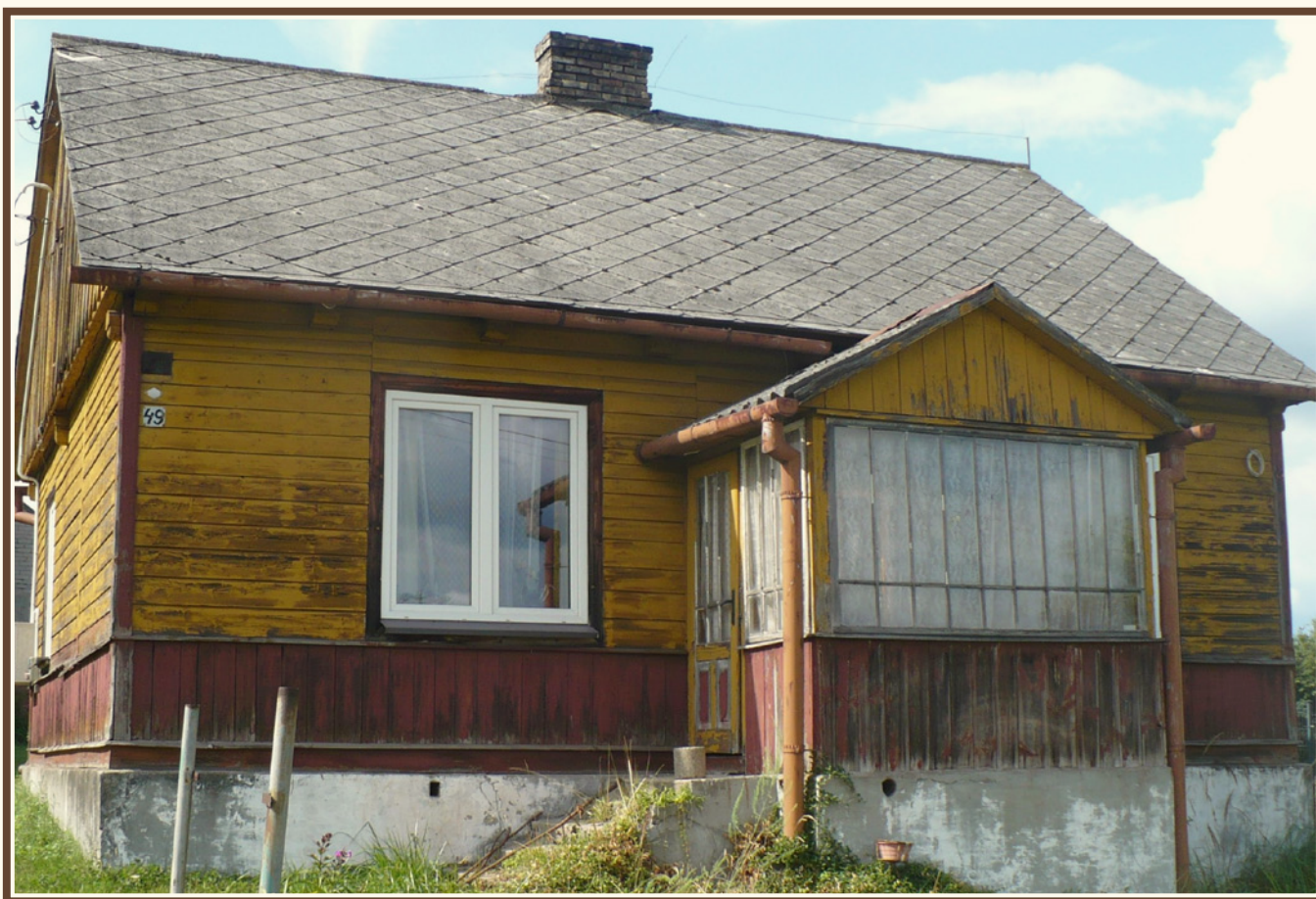
Przykład najpopularniejszego przydomowego ganku zamkniętego z dwuspadowym dachem, fot. Piotr Kardys