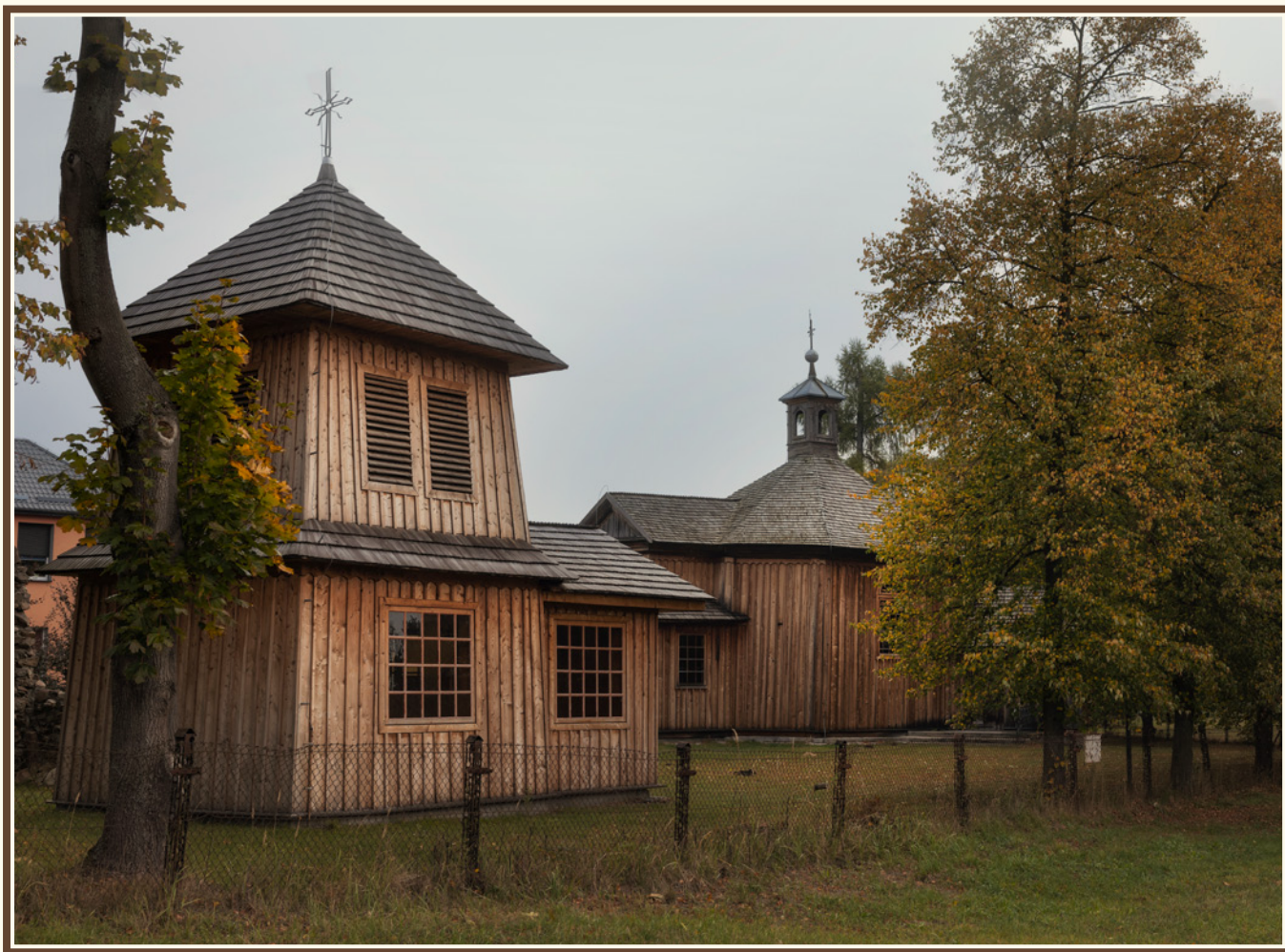
Kaplica pod wezwaniem. św. Rocha w Mroczkowie, fot. Krystian Drózdź.