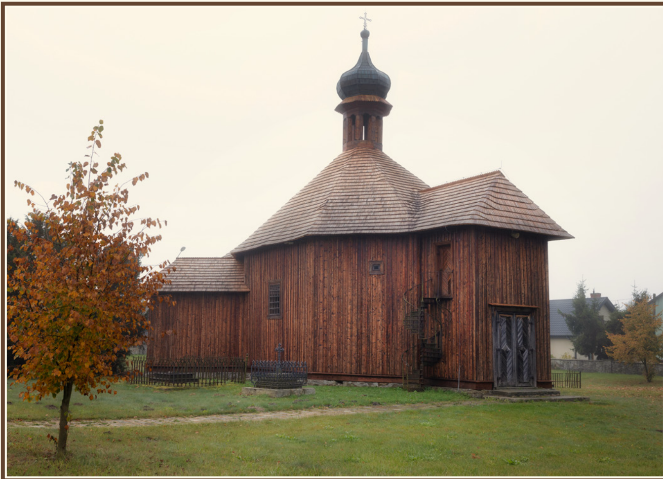
Kaplica św. Zofii w Bliżynie, fot. Krystian Drózdź.