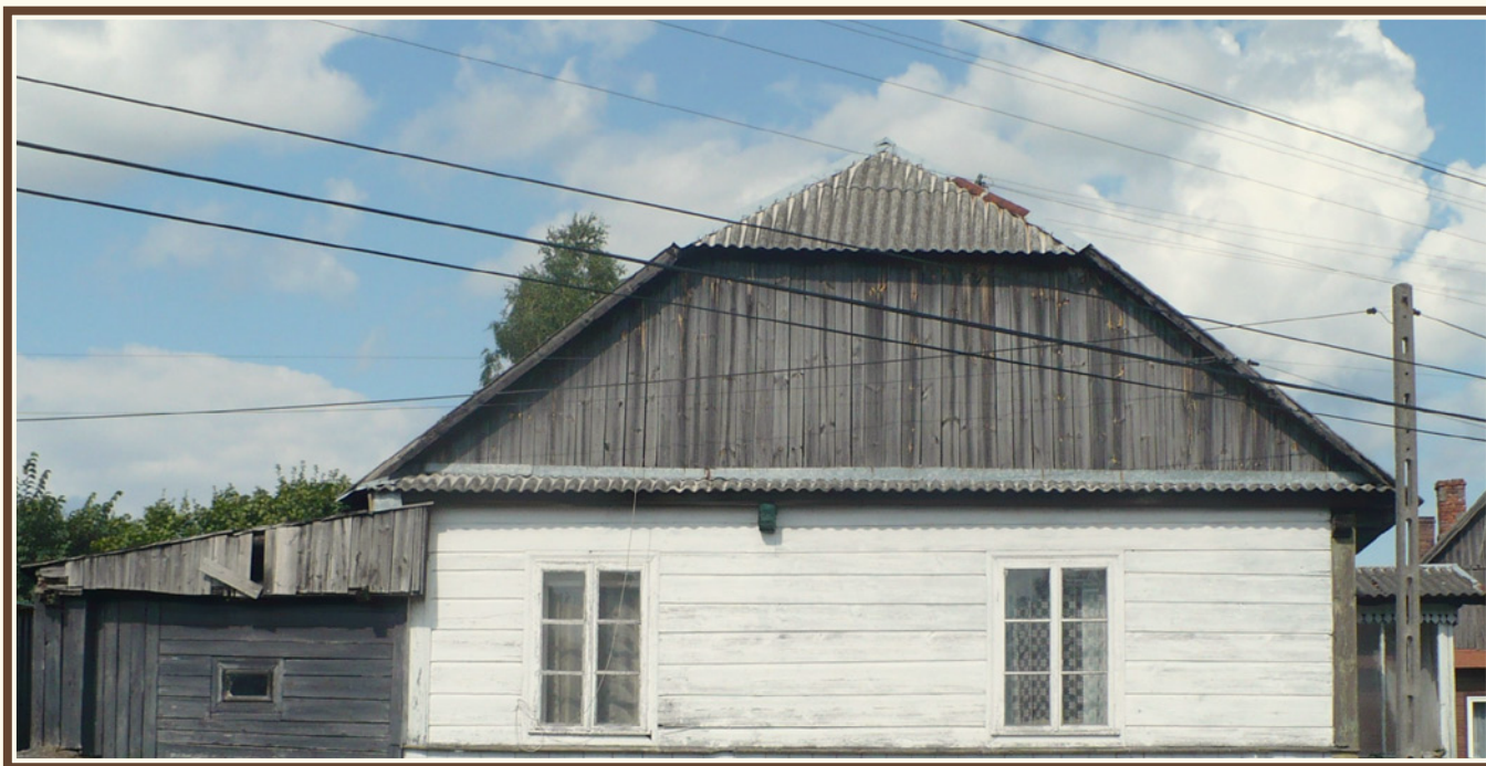
Przykład dachu typu naczółkowego (Osełków)