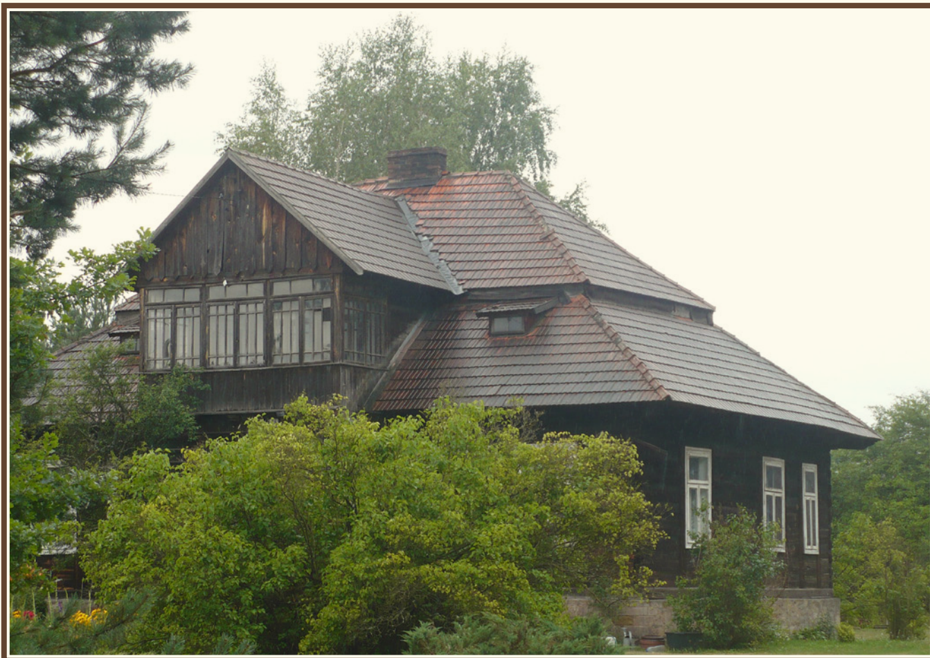
Przykład konstrukcji dachu wielospadowego (Suchedniów), fot. Piotr Kardys