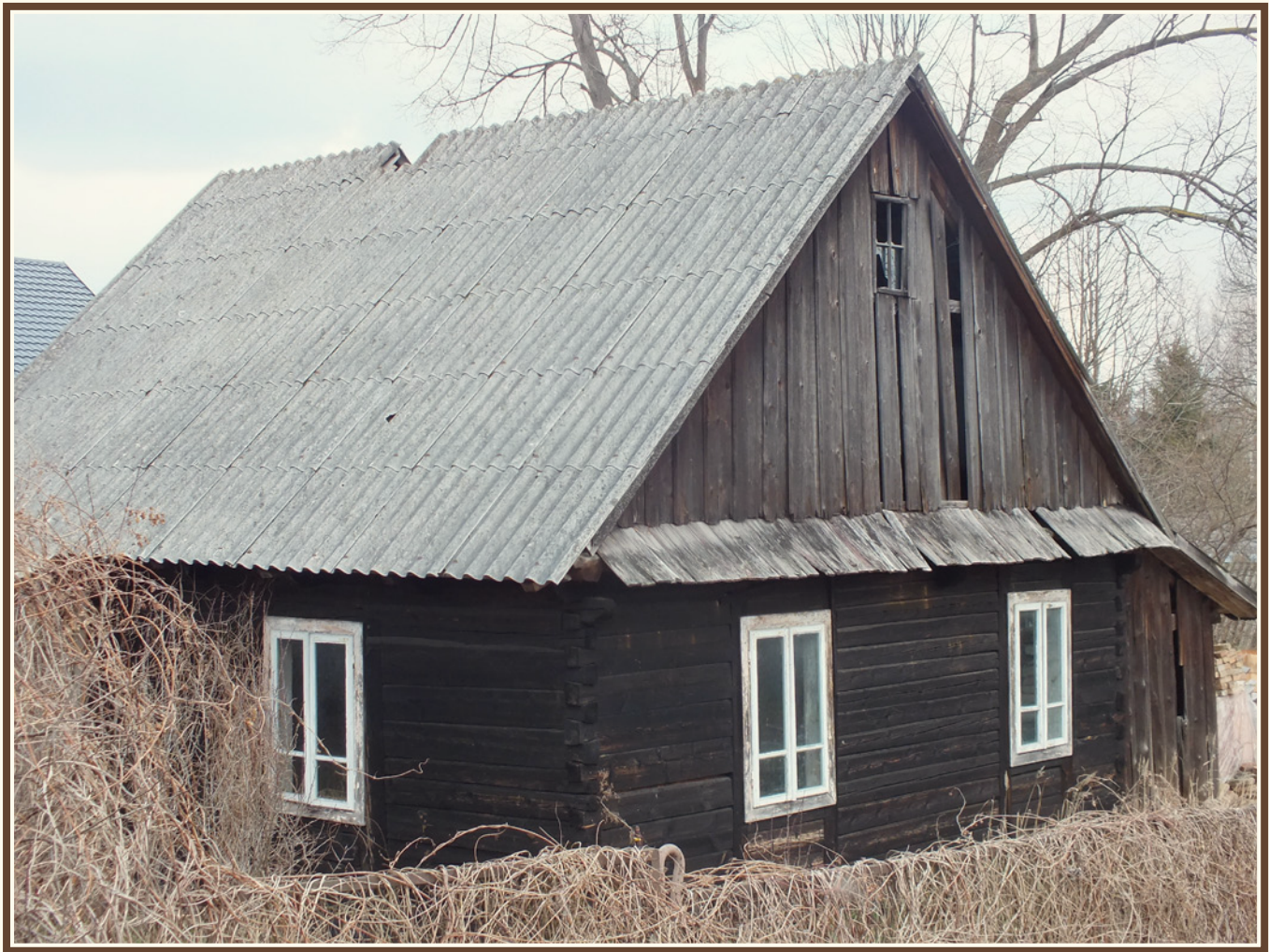
Przykład konstrukcji dwuspadowej dachu z tzw. okapem (Bliżyn)