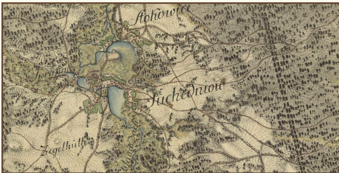
„Suchedniów” – fragment mapy Carte von West-Gallizien welche [...] in den Jahren von 1801 bis 1804 unter Direction [...] Anton Mayer von Heldensfeld [...] aufgenommen worden. Gezeichnet, und gestochen von Hieronimus Benedicti.

W tym czasie w sąsiednich miejscowościach obecnej gminy suchedniowskiej notowano już liczną zabudowę mieszkalną. W Berezowie było to odpowiednio około czterdzieści domostw, w Baranowie trzydzieści pięć, w Ostojowie siedemdziesiąt siedem, w Konstancyńowie sześć, w Michniowie zaledwie dwadzieścia dziewięć, w Stokowcu trzydzieści pięć, w Jędrowie i Ogonowie szesnaście, Błoto liczyło zaledwie trzy domostwa, w Mostkach dwadzieścia domostw (ponadto zabytkowy budynek