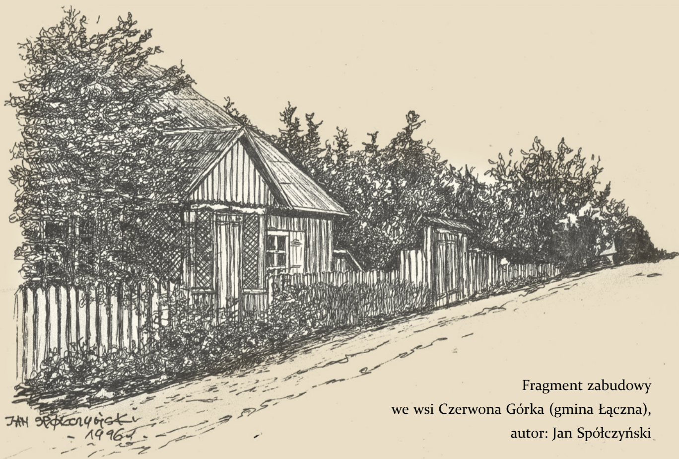
Fragment zabudowy we wsi Czerwona Górka (gmina Łączna), autor: Jan Spółczyński