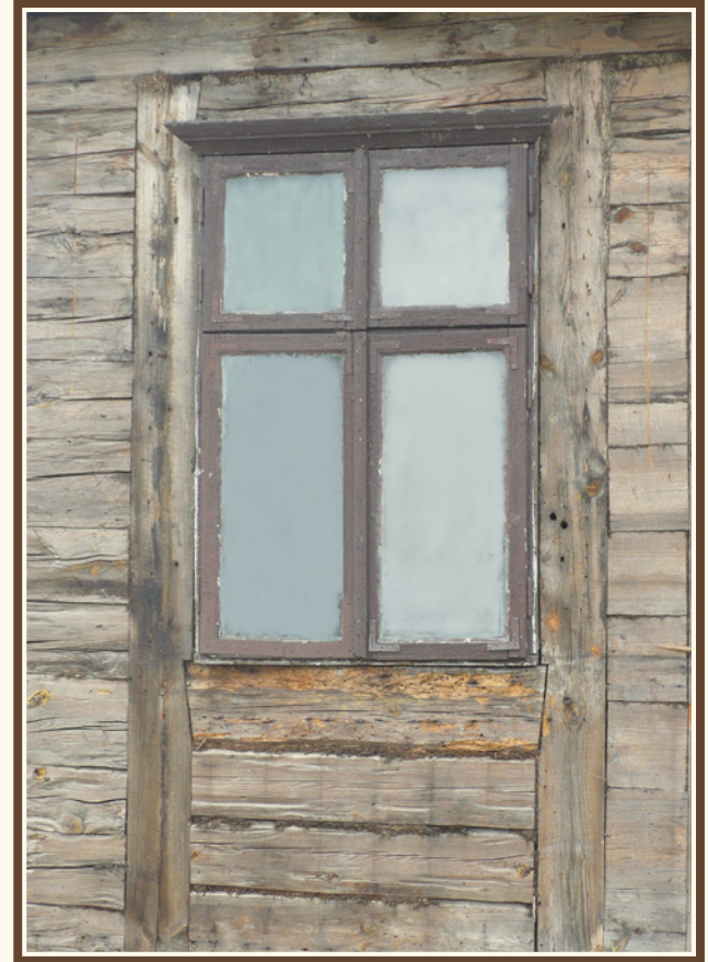
Przykład osadzenia ramy okiennej w łątkach i budowy ściany frontowej metodą sumikowo-łątkową