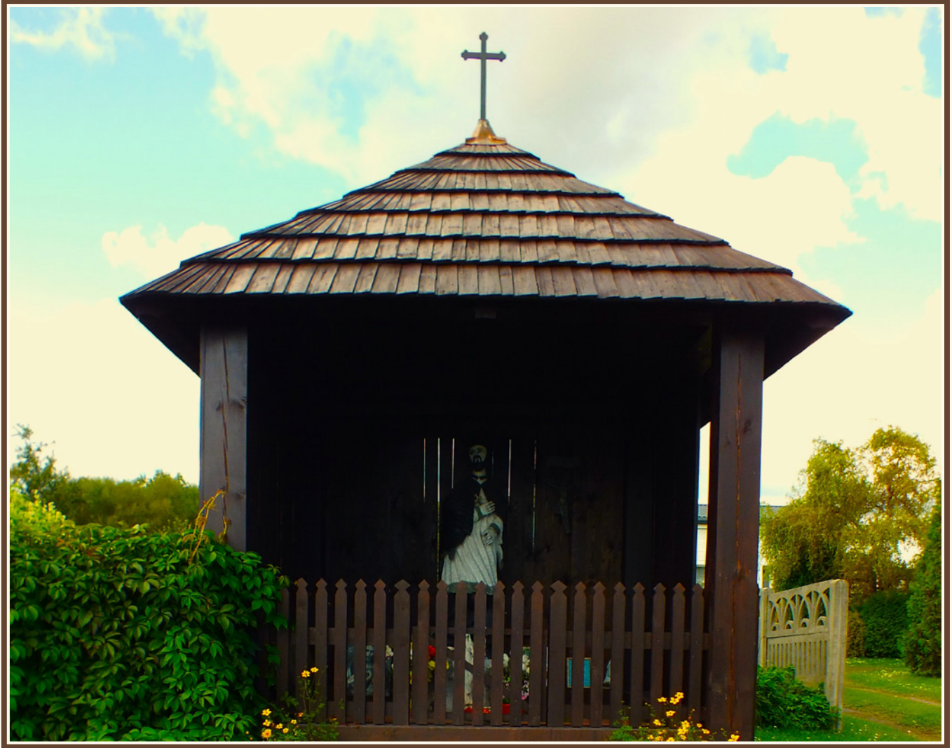
Kaplica drewniana poświęcona Janowi Nepomucenowi w Suchedniowie