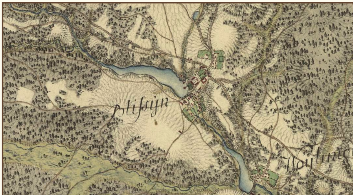
„Bliżyn” – fragment mapy Carte von West-Gallizien welche [...] in den Jahren von 1801 bis 1804 unter Direction [...] Anton Mayer von Heldensfeld [...] aufgenommen worden. Gezeichnet, und gestochen von Hieronimus Benedicti.

Nie wiemy nic o jego początkowej zabudowie, poza tym, że określany był jako wieś z karczmą, dwoma, a z czasem nawet z pięcioma kuźnicami, dworem, folwarkiem, browarami, gorzelnią i młynem. W XVIII wieku stał już w Bliżynie dwór murowany z oficyną, cegielnia, piec wapienny, wielki piec, olejarnia i dwadzieścia drewnianych domostw włościańskich (z budynkami gospodarczymi, jak szopy/stodoły, obory, chlewiki i kurniki). Pośrednią informacją o ówczesnej zabudowie drewnianej jest opis klucza bliżyńskiego, w którym wyliczono 81 domów włościańskich.