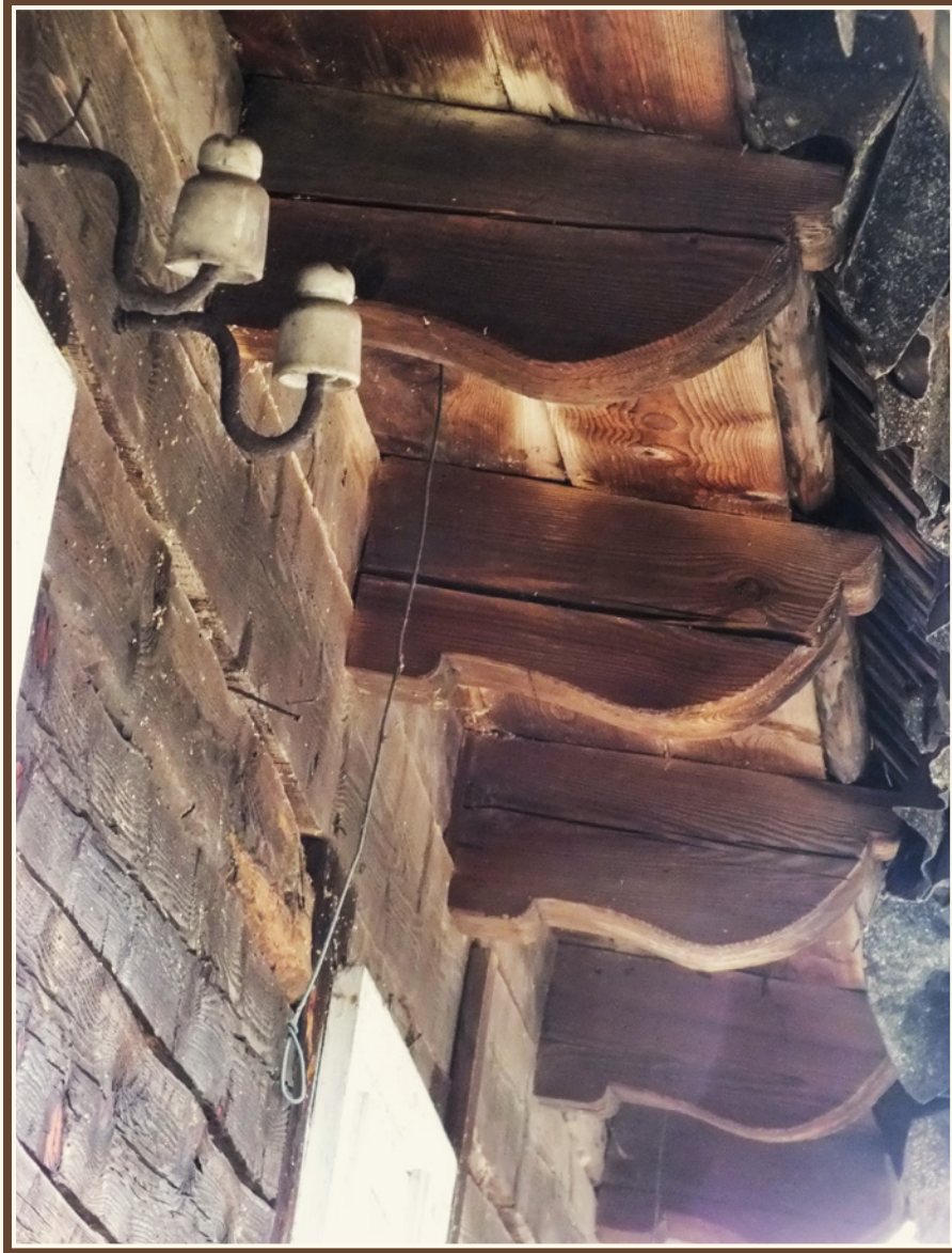
Przykład ozdobnego wykończenia belek stropowych