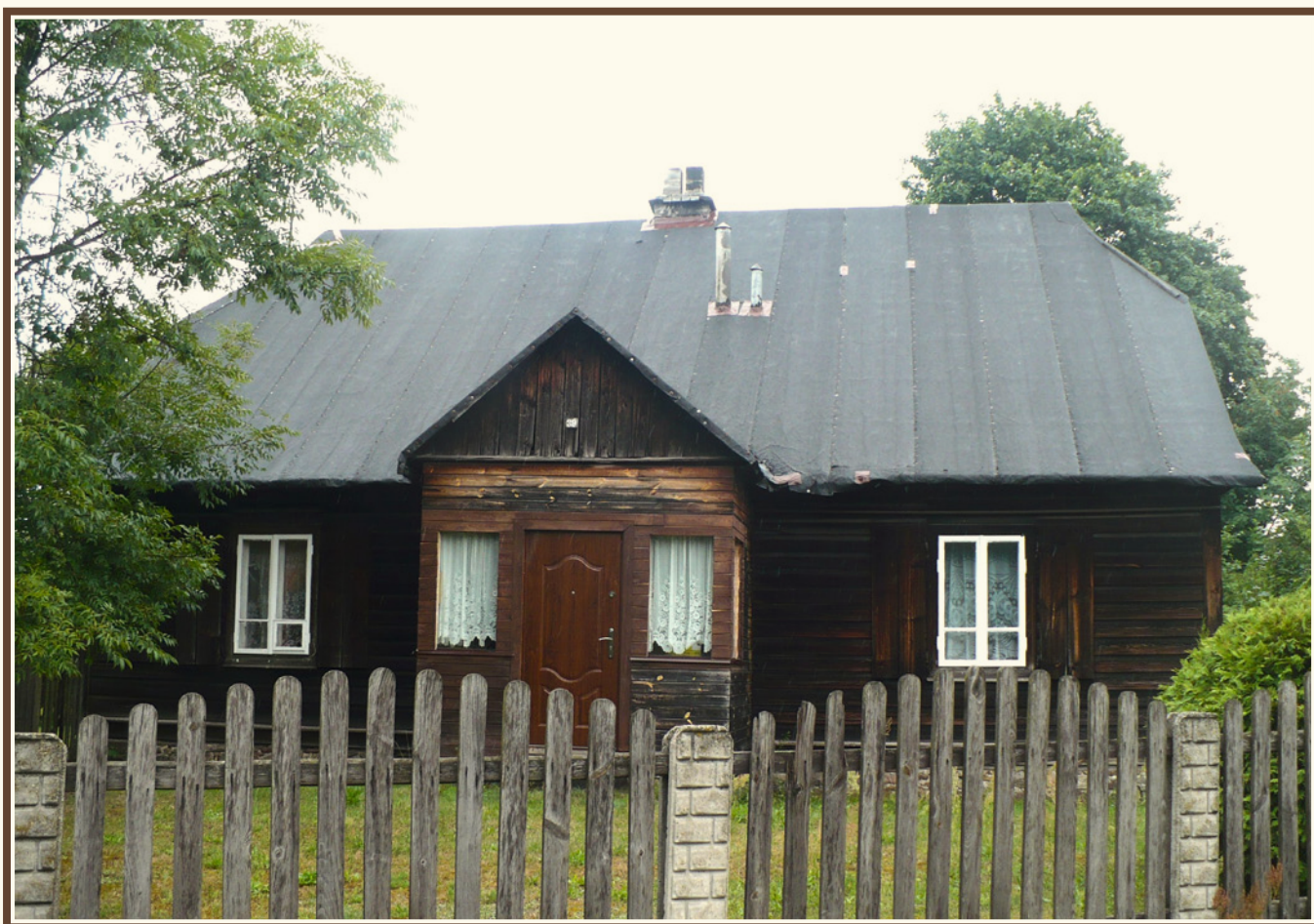
Zabudowania typu dworskiego przy ul. Bodzentyńskiej w Suchedniowie, fot. Piotr Kardyś.