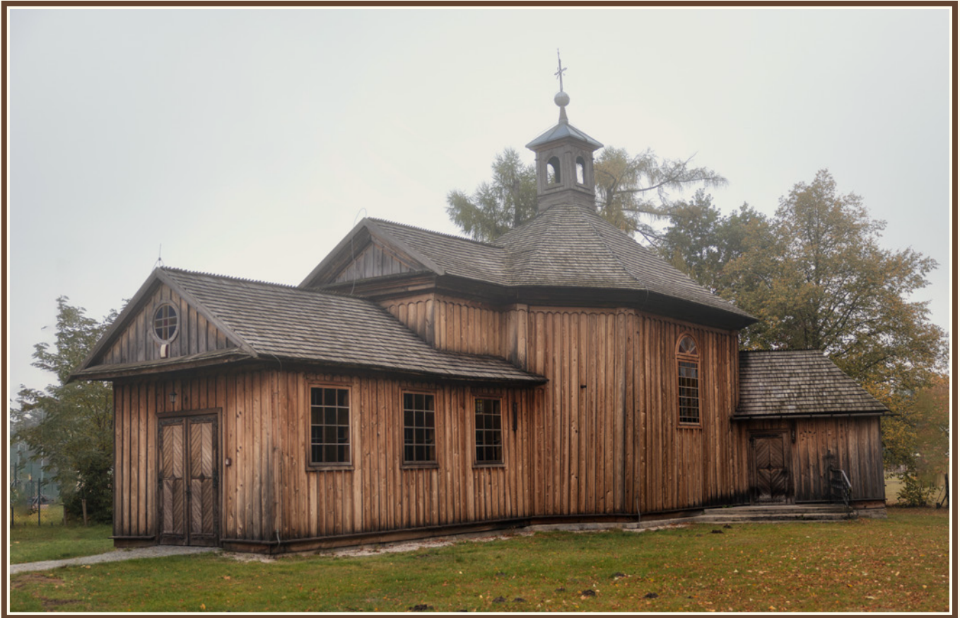
Kaplica pod wezwaniem. św. Rocha w Mroczkowie, fot. Krystian Drózdź.