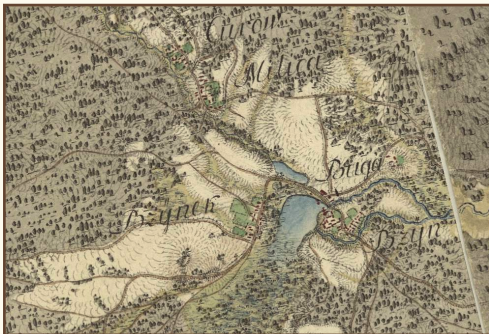
Fragment mapy Carte von West-Gallizien welche [...] in den Jahren von 1801 bis 1804 unter Direction [...] Anton Mayer von Heldensfeld [...] aufgenommen worden. Gezeichnet, und gestochen von Hieronimus Benedicti.

Już na przełomie XIX/XX stulecia liczby domów drewnianych przedstawiały się imponująco w stosunku do danych sprzed wieku: np. w Bzinku było ok. setki domów, w Kamiennej ponad dwieście pięćdziesiąt, w Milicy ok. siedemdziesiąt, w Pogorzałym ok. osiemdziesiąt, w Skarżysku Książęcym ponad półtorej setki.