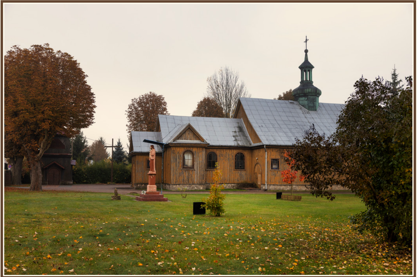
Kościół pod wezwaniem św. Józefa Oblubieńca NMP w Skarżysku-Kamiennej, fot. Krystian Drózdź.