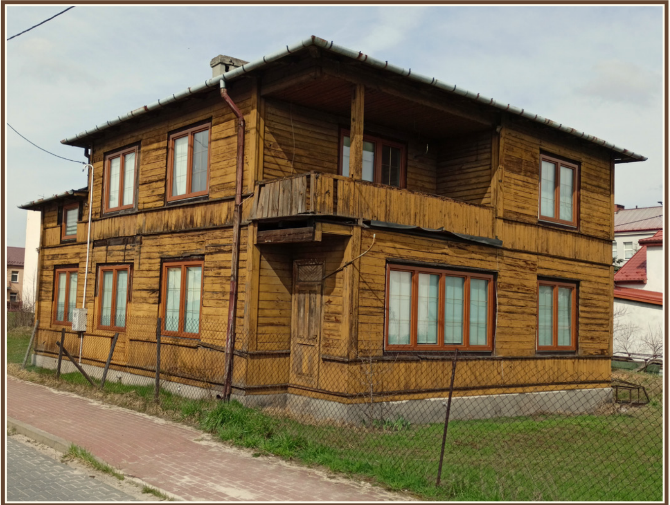
Przykład miejskiego budownictwa dawnego Skarżyska-Kamiennej, budynek nawiązujący stylistycznie do obiektów typu kurortowego, obecnie przy ul. 1 Maja, fot. Marcin Janakowski