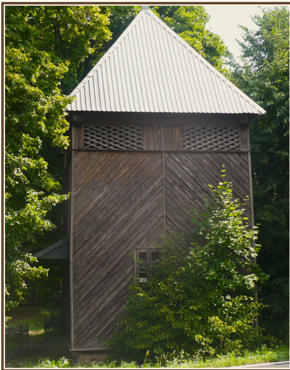
Dzwonnica przy kościele parafialnym w Łącznej, fot. Piotr Kardys