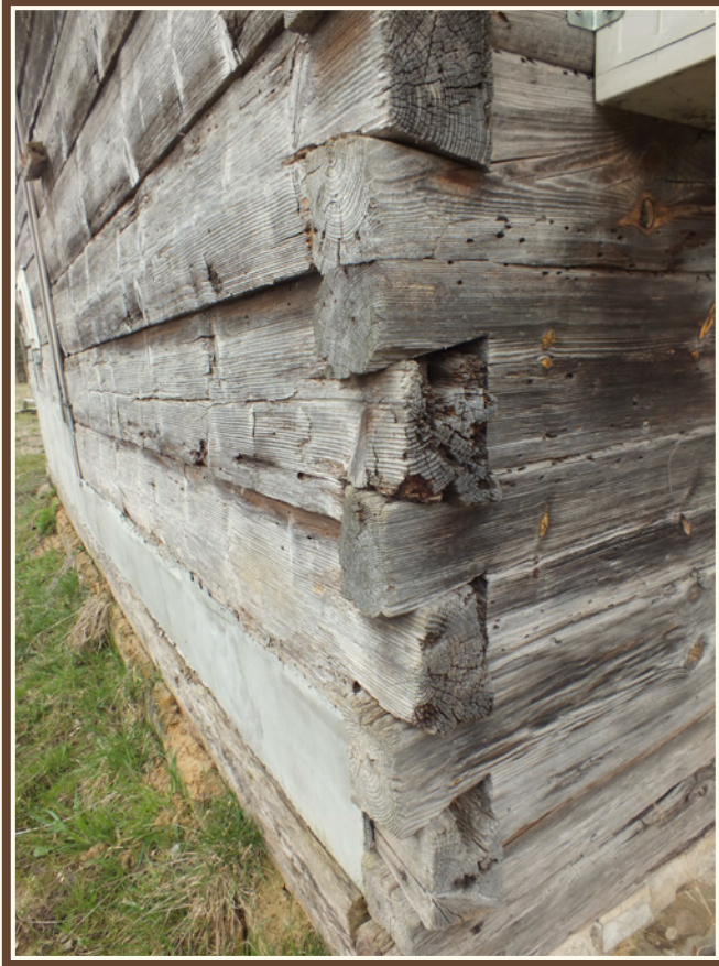
Przykład dobrze widocznej konstrukcji zrębowej (Suchedniów)